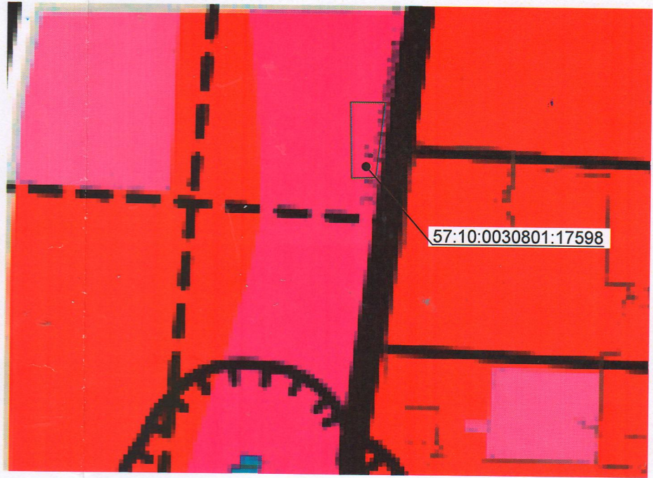
Фрагмент карты документации по планировке территории "Корректировка №2 проекта планировки территории микрорайона "Зареченский" города Орла" (с изменениями)