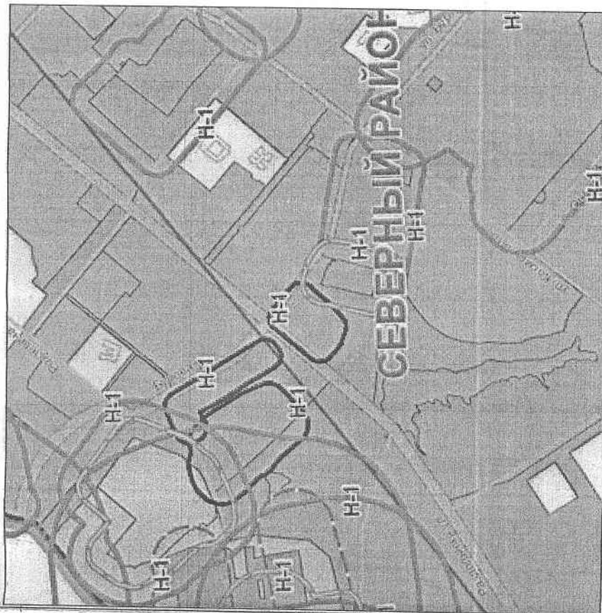
Ситуационный план б/м