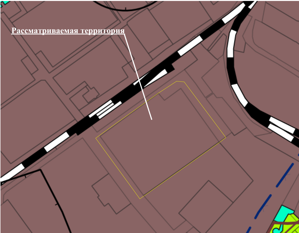
Фрагмент Карты границ территорий объектов культурного наследия и зон охраны объектов культурного наследия (Генеральный план городского округа "Город Орел")