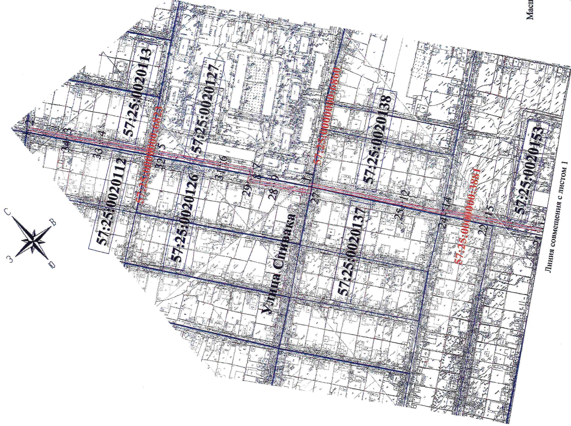
Линия совмещения с листом 1

Площадь земельного участка для установления публичного сервитута 5766 кв. м.