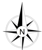
Схема размещения поликлиники на 600 посещений в смену на части территории в районе детской поликлиники №3 по ул.Герцена, д.21 и Герценского моста (Вариант 1)