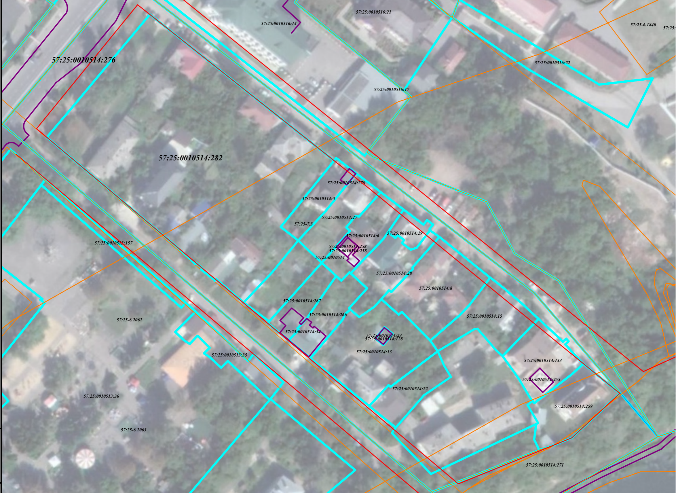
Схема границ существующих земельных участков и местоположения существующих объектов капитального строительства