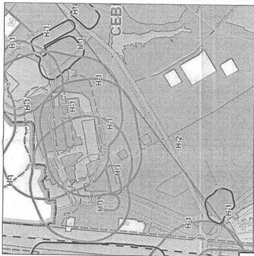
Ситуационный план б/м